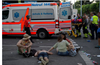
Remise des frais et émoluments manifestations page 3