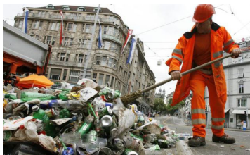
Ville de Zurich Département de la sécurité