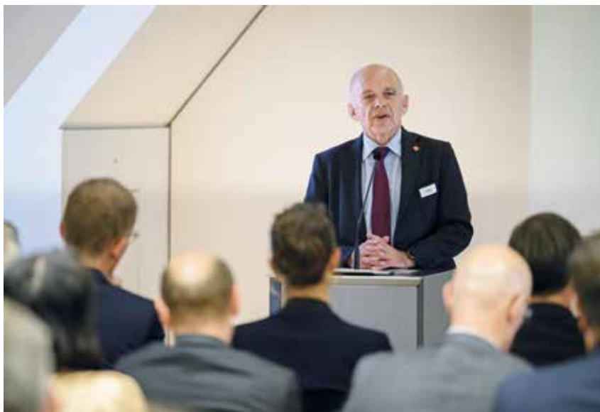
Bundesrat Ueli Maurer gab in seinem Schlusswort an der Mitgliederversammlung einen Ausblick zur Botschaft des Bundesrats.